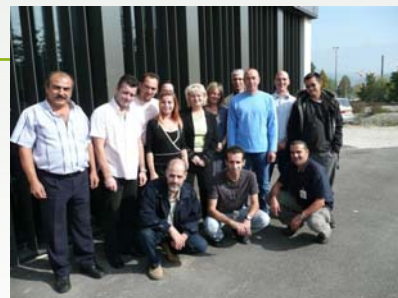
Groupe « Parcours Gardien 1 » de Grenoble