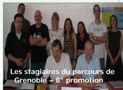
Les stagiaires du parcours de Grenoble – 8 e promotion